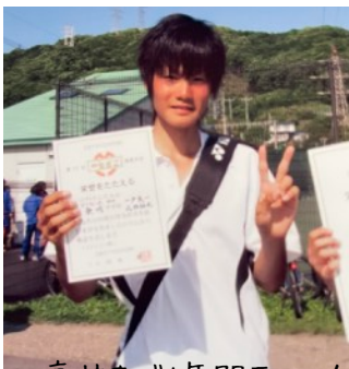
高校まで6年間テニス!