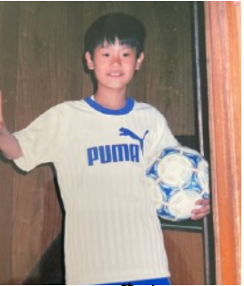
サッカーに夢中になって いた時

室蘭出身の3人兄弟の2人の姉をもつ末っ子です。 実家ではトイプードルを飼っています。→ 高校まで6年間テニス! 趣味 ギルフレドラムを叩くことにはまっています^_^